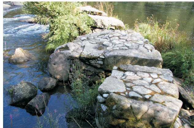
Nos rápidos do Tambre atópanse os restos de antigos rodeiros -onde se detiña a corrente e se aproveitaba para pescar lampreas, reos e salmóns- e pesqueiras onde se colocaban as redes para pescar lampreas.

O punto de partida é Roo a onde se pode chegar desde Noia, pola estrada de Noia a Santiago collendo un cruce á esquerda a uns tres quilómetros, ou desde Pontenafonso. Séguese a estrada que leva ata a Central do Tambre (4,5 km) onde hai que deixar o coche. A ruta faise por un sendeiro acondicionado que segue o curso do río.