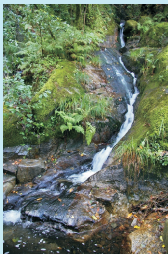
Fervenza nun regueiro afluente do Tambre