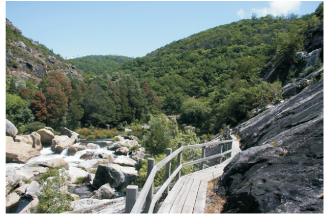
Ruta acondicionada polo canón do Tambre

A Devesa de Nimo atópase na marxe esquerda do río Tambre, entre a central eléctrica e o concello de Brión. É un bosque atlántico ben conservado no que podemos atopar carballos, cerquiños, loureiros, acivros, avelairas, estripas, cerdeiras, maceiras silvestres, salgueiros, amieiras, freixos, sanguíños, érbedos, pereiras bravas e gran variedade de fentos, brións e fungos, coa súa fauna asociada.